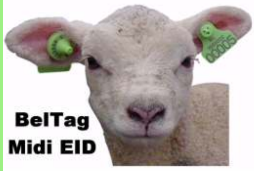
BelTag Midi EID

Beljaars Schapenpraktijk Kampweg 5 5447 NK Rijkevoort Tel. 0485-371995 Fax. 0485-372335